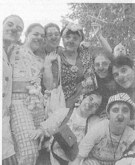
I down di corsia e Pimpinella I volontari dell'associazione dei down di corsia «L'Arte del Sorriso» presentano orgogliosi Pimpinella, la prima marionetta che ha avuto l'onore di partecipare alla StraAsti. I volontari dell'associazione sono stati senza dubbio il gruppo più colorato presente in piazza Alfieri. Con i loro nasi rossi e la loro simpatia hanno «riscaldato» l'atmosfera prima del via