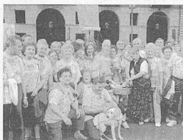
Way Assauto al 2° posto I «podisti» del circolo «Way Assauto» di corso Pietro Chiesa ad Asti. Nella speciale classifica riservata ai gruppi si è classificato al secondo posto con 229 iscritti