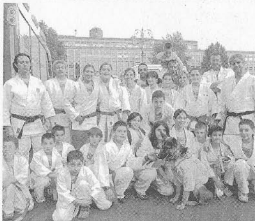
Dal tatami alla strada Cinture di tutti i colori nel numeroso gruppo dei judokas appartenenti alla Polisportiva Cassa di Risparmio di Asti. Immacabile il cane-mascotte con la maglietta gialla d'ordinanza