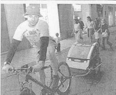
La mascotte ufficiale In alto, due bimbi tra il coniglietto Suerte, la mascotte ufficiale della StraAsti. Sopra, un papà che ha partecipato alla StraAsti con una speciale bicicletta, perfettamente attrezzata per il trasporto (comodo) dei bambini. Numerosi i partecipanti con prole al seguito