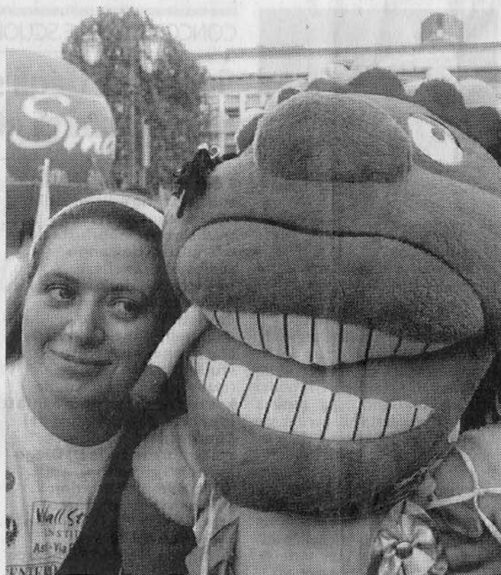
Alla partenza in piazza Alfieri della «StraAsti» del maggio scorso

datore del Gruppo Pegaso, devolgerà una quota di 6.000 euro al sodalizio che astigiano che si occupa di far fare sport ai disabili. Altri contributi per complessivi 2000 euro andranno all'Unicef, al Som (Solidarietà odontoiatri-